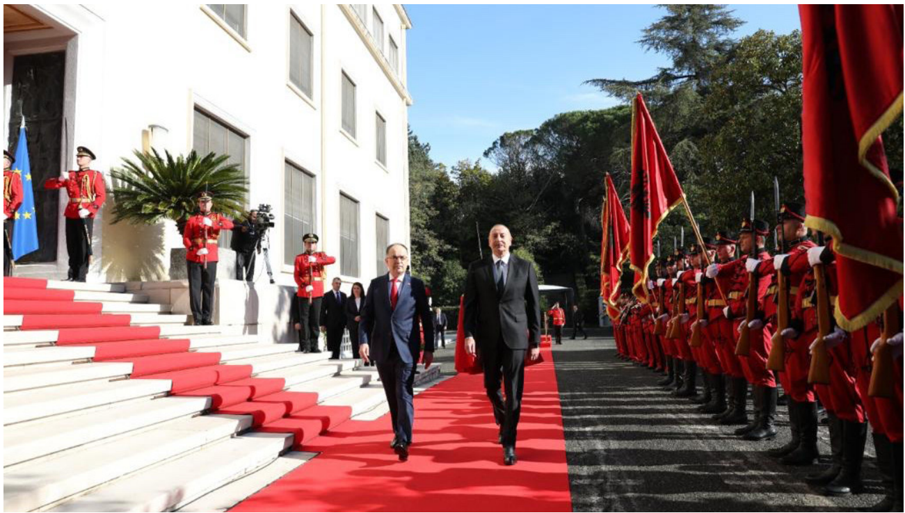
Pamje nga vizita e Presidentit të Azerbajxhanit në Shqipëri më 15 Nëntor 2022

me një zonë të veçantë dhe nëse investimi është i suksesshëm, shtrirja e tij mund të rritet.