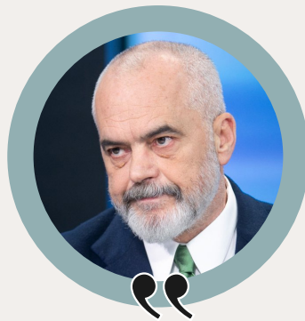
Kryeministri i Shqipërisë, Edi Rama

Jam jo vetëm shumë i keqardhur, por edhe seriozisht i shqetësuar. Sepse ky hap i hedhur si këmba e elefantit në një dyqan qelqurinash, mund të sjellë pasojën regresive të rindezjes së flamës së nacionalizmit, e të ndjenjave negative reciproke që ajo flamë lind në shtresa të keqinformuara