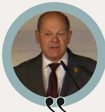
Kancelari i Republikës Federale të Gjermanisë, Olaf Scholz

“Shqipëria njihet për mikpritjen dhe kjo është vërtetuar edhe njëherë sot. Ne e kemi kuptuar edhe kur kemi pasur takimin e Këshillit Evropian. Për takime të shumta të nivelit të lartë e ministriale në kuadër të procesit të Berlinit. Kanë qenë efikase e të përgatitura shumë mirë. E mbaj mend shumë mirë kur u takuam vjet në Berlin dhe të gjithë ramë dakord që Procesi i Berlinit është instrumenti më i mirë jo vetëm që të çlirohet potenciali i plotë i bashkëpunimit rajonal, por edhe