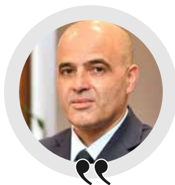
Kryeministri maqedonas, Dimitar Kovačevski