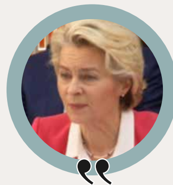
Presidentja e Komisionit Evropianë, Ursula Von Der Leyen

Po ashtu, zyrtarja e lartë e Bashkimit Evropianë, vlerësoi si mjaft të rëndësishëm çeljen e programit master në Kolegjin e Evropës që do të zhvillohet në Tiranë nga