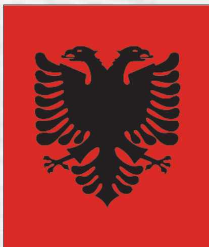
Zhvillimet politike në Shqipëri gjatë vitit 2023

Sa i përket zhvillimeve politike në Shqipëri dhe Rajon, mund të themi se ishte një vit i karekterizuar nga tensione dhe përplasje politike. Vlen për tu theksuar sulmi terrorist në Banjskë nga Serbia që rrezikoi edhe njëhere sigurinë dhe paqen në Ballkan.