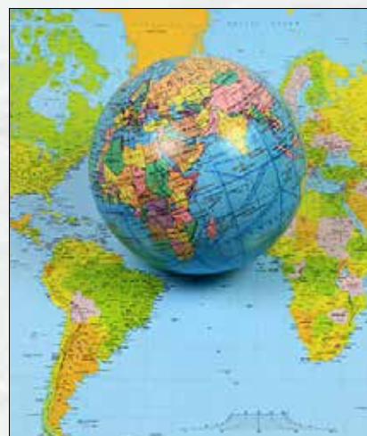
Zhvillimet politike në Botë gjatë vitit 2023