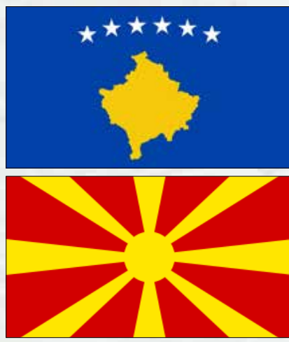
Zhvillimet politike në Rajon gjatë vitit 2023