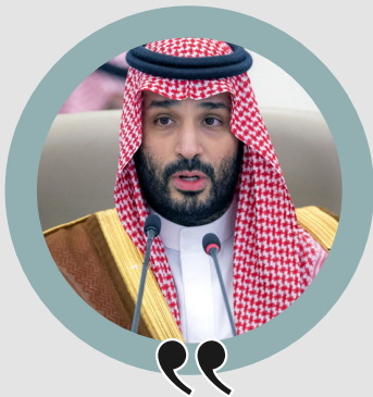
Israeli PM Benjamin Neta-nyahu

However, the expansion of the BRICS bloc raises the profile of Russia and incidentally their ally, Iran, because of their contempments with the US. Some world public opinion is turning against the US government, even citizens within their own country as they become more aware of the Israel – Palestine situation, and the harsh treatment meted out to